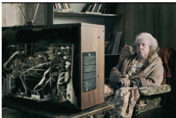
Рис. 5. Мать Журова перед телеэкраном