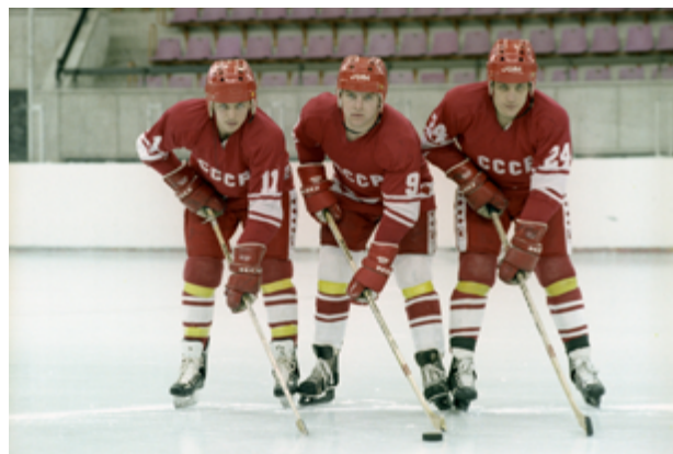
Рис. 2. Советские хоккеисты В. Крутов, И. Ларионов, С. Макаров