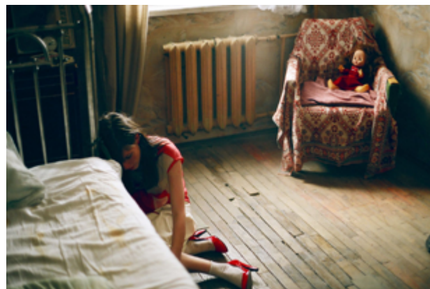
Рис. 4. Красные туфли на ногах Анжелики