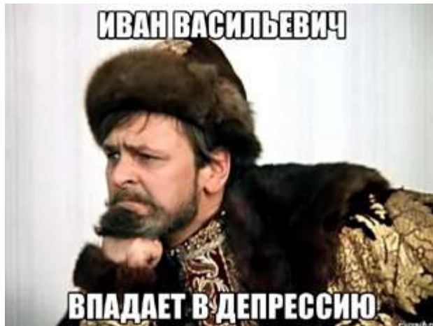
Рис. 3. Интернет-мем «Иван Васильевич меняет профессию»

прессию», «сдает сессию», «готовит диверсию», «не одобряет репрессии» и т. п.