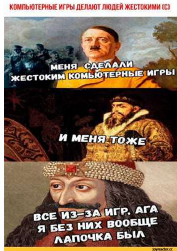
Рис. 2. Интернет-мем «Компьютерные игры делают людей жестокими»

Также мемы о Грозном эксплуатируют тему жесткости Ивана IV, надписи содержат угрозы посадить на кол, казнить, портретные изображения царя помещают в одном ряду с портретами Влада III Цепеша (Дракулы) и Адольфа Гитлера.