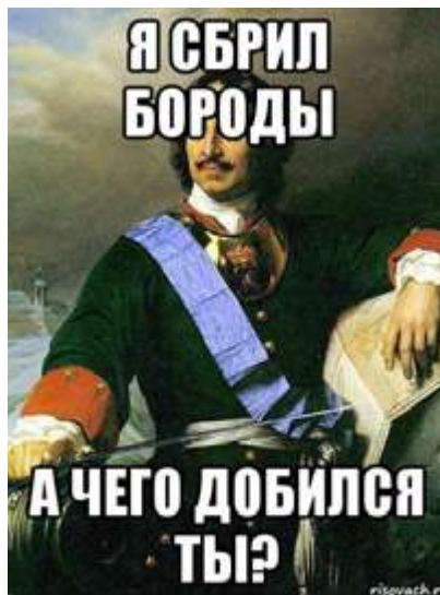
Рис. 6. Интернет-мем «А чего добился ты?»

Встречаются мемы, посвященные строительству флота («Игра “Русский кит”. Вырежи флот у себя на руке. Разбуди меня в 17:21») и созданию бюрократического аппарата управления («Указую общаться токмо через СЭД, чтоб дурь каждого видна была!»). Однако наибольшей популярностью пользуются мемы, связанные с мифом о строительстве Санкт-Петербурга на болотах, где Петр I неожиданным образом стал ассоциироваться с персонажем мультфильма киностудии DreamWorks Pictures Шрек. Первый мем, ставший началом вирусного распространения образа, представлял собой портрет императора с надписью: «Осел! Нет никаких “мы”, нет никакого “наше”. Есть только я и мое болото! – Шрек». В дальнейшем волна репликаций привела к появлению в этих мемах других героев, но неизменным осталась связь образа Петра I с болотным орком.