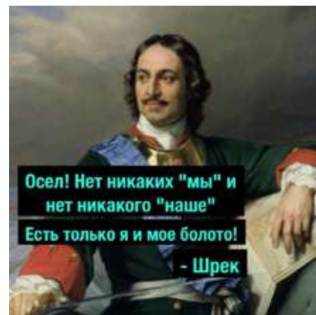
Рис. 7. Интернет-мем «Петр I – Шрек»

Встречаются мемы, посвященные строительству флота («Игра “Русский кит”. Вырежи флот у себя на руке. Разбуди меня в 17:21») и созданию бюрократического аппарата управления («Указую общаться токмо через СЭД, чтоб дурь каждого видна была!»). Однако наибольшей популярностью пользуются мемы, связанные с мифом о строительстве Санкт-Петербурга на болотах, где Петр I неожиданным образом стал ассоциироваться с персонажем мультфильма киностудии DreamWorks Pictures Шрек. Первый мем, ставший началом вирусного распространения образа, представлял собой портрет императора с надписью: «Осел! Нет никаких “мы”, нет никакого “наше”. Есть только я и мое болото! – Шрек». В дальнейшем волна репликаций привела к появлению в этих мемах других героев, но неизменным осталась связь образа Петра I с болотным орком.