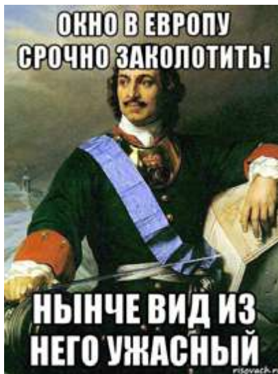
Рис. 5. Интернет-мем «Окно в Европу»