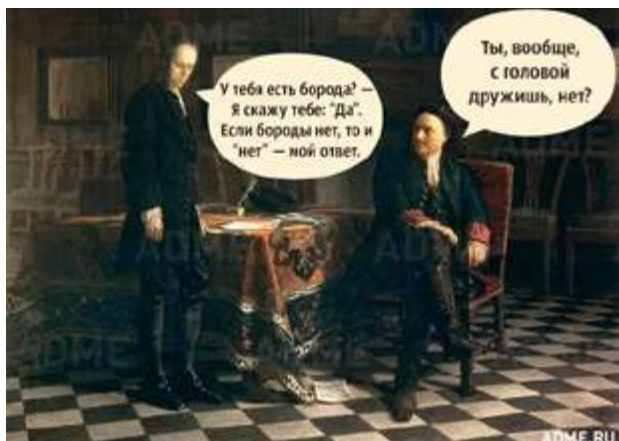
Рис. 8. Интернет-мем «Петр I и царевич Алексей»

В имеющих массовое хождение мемах фигура царевича Алексея Петровича не встречается. Исключение составляет интернет-мем на основе картины Николая Ге «Петр I допрашивает царевича Алексея Петровича в Петергофе», где царевичу приписаны слова: «У тебя есть борода? – Я скажу тебе: “Да”. Если бороды нет, то и “нет” – мой ответ», а императору фраза: «Ты, вообще, с головой дружишь, нет?» Популярность этого мема связана только с тем, что в нем обыгрывается строчка из известной песни популярного рэп-исполнителя Doini, а не с историей взаимоотношений отца и сына. Хотя следует признать, в некоторой степени этот мем иллюстрирует суть разногласий исторических героев: как известно, одной из главных претензий к Алексею, ставшей обвинением, была его приверженность старинному русскому укладу, символизируемому бородой.