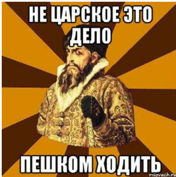
Рис. 1. Интернет-мем «Не царское это дело»

вое распространение получили интернет-мемы с использованием картины В.М. Васнецова «Царь Иван Васильевич Грозный», из которых самый популярный мем – «Не царское это дело».